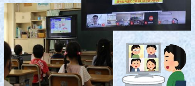
オンラインによるクラスの様子↓