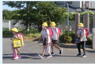
↑登校の様子(高松小学校)

学校では、手洗いや手指の消毒や換気、ソーシャルディスタンスに気を付けながら、子どもたちが安心安全に学校生活が行えるよう対策をしています。