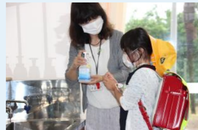
↑手指の消毒の様子(三笠小学校)

今年の7月は梅雨が長引き気温が低く比較的過ごしやすい時期でしたが、8月に入ってから、熱中症警戒アラートが発表される日が多く、連日猛暑日が続きました。9月になってからも暑さは続きますので、熱中症にならないよう、こまめな水分補給や日頃からの健康管理を行いましょ。