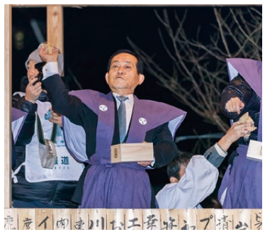
▲2月3日に鹿島神宮で行われた節分祭で、今年も皆さんに福が訪れるように「福うち」

目標達成は行政だけでは困難であり、この計画に位置付けた事業および措置に対して、総合的かつ効果的に国から支援を受けることができますので、民間活力を取り入れながら、計画事業の実施、目標達成に向け、邁進していきます。