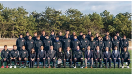
▲鹿島アントラーズの宮崎キャンプを訪問し、選手を激励しました

「鹿嶋市中心市街地活性化基本計画」が、昨年12月26日に内閣府総理大臣の認定を受けました。