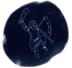
▲オリオンの右肩の赤い星がベテルギウス

詳しくは、同センターホームページ( http://ksrc.nict.go.jp/ )をご覧ください。なお、本紙3月1日号にも掲載予定です。