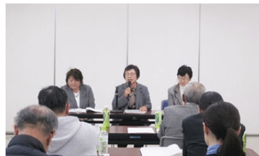
▲1月に行われた民生委員研修会の様子

各委員が担当する地域において、高齢者や障がいのある人の福祉に関すること、子育てなどの不安に関することなど、さまざまな支援を行っています。 ○家庭訪問、電話相談 ○生活保護、準要保護、児童扶養手当の意見書の提出など