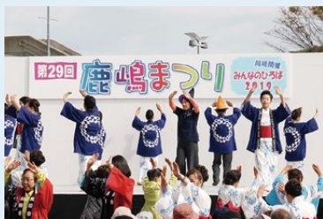
▲鹿嶋まつりで東京五輪音頭-2020-を披露した鹿嶋市舞踊連盟の皆さん

鹿嶋市で、東京2020オリンピックサッカー競技が開催されることから、多くの観戦者が鹿嶋市を訪れることとなります。 そのため、鹿嶋市文化協会やまちづくり市民センターで活動する団体などで組織する「オリンピックを楽しむ市民の会」が、「KASHIMA文化交流フェスティバル」の開催に向けて準備をしています。KASHIMA文化交流フェスティバルは、東京2020オリンピック鹿嶋市開催を祝い、機運醸成を高める目的で、オリンピック期間中に三つの事業を開催します。 一つ目の事業は鹿嶋市交流美術展です。絵画、書、写真、工芸、自由創作の5種目について公募を行