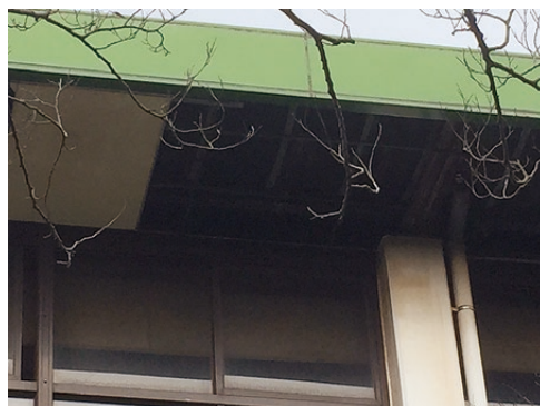
▲高松緑地体育館の外回り。屋根の裏側は抜けてしまっている。

この条例は、昭和50年に建築された高松緑地体育館の老朽化が著しいため、廃止をするものです。