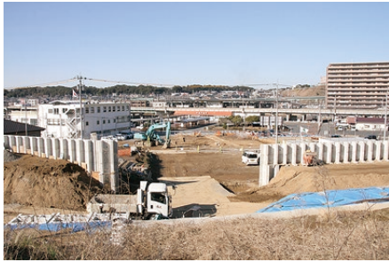
▲鹿島神宮駅前では、滑動対策工事なども進んでいる。

討論はありませんで した。委員会は、全議案に ついて、原案のとおり可決 すべきであると決定しま した。