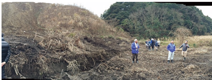
▲花の山地区の無許可埋め立て地を視察。

無許可埋め立て地について、地区の皆さんなどからの要望を受け、委員会で現地を視察し、状況を確認しました。