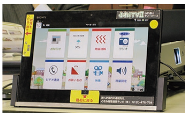
▲機能をしぼり、高齢者でも直感的に操作できるように工夫。

富山県南砺市では、婚活支援事業、空き家対策、「ふれiTV」による高齢者支援事業を視察しました。少子化は結婚の減少が原因と分析し「おせっかい」というグループが48件の成婚を目標に、7月現在で38件の実績を出しています。「ふれiTV」(写真集落にタブレット端末を配付し、安否確認・防災無線・買い物・テレビ電話機能など、お年寄りの支援をしています。特筆すべきは高齢者が使いやすい操作に最大の工夫をしている点です。今回の視察結果をもとに、市で活用出来るものはないか、委員会で検討していきたいと考えます。