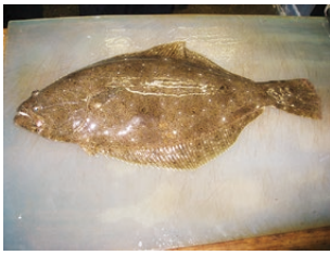
◀ヒラメの旬は冬。淡白で繊細な味が、大人にも子供にも好まれる。