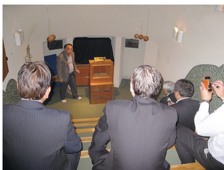
▲伊万里焼の登り窯をかたどった幼児への読み聞かせの部屋。暗くなると、天井に星座が映し出される。

次に、幼児教育の必要性が再認識されている今日において、佐世保市の保育園も含めた保幼小接続連携カリキュラムは、市内全体で公立・私立の隔たりなく、小学校区ごとの幼小教育の温度差を解消する体系的な取り組みであり、本市においても研究すべき点が多いと感じました。行政が主体となり幼児期の「遊び」から「学び」への移行をスムーズに行えるよう、また保育者、教師の連携をサポートし、コーディネートしていく体制づくりが必要と考えます。 行政組織においても、保育園、幼稚園の所轄は異なり、課題も多くありますが、一体的かつフレキシブルに活動できる部局編成を検討すべきと考えます。