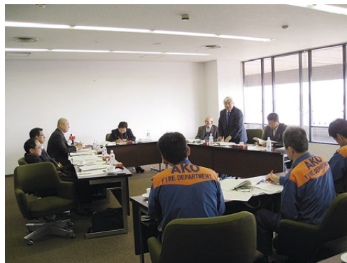
▲赤穂市での女性消防団の調査。今後の課題は「山火事などの大規模災害時の活動のあり方」とのこと。