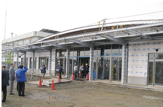
▲新保健センターの玄関口付近の様子。完成が待たれます。