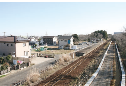
▲荒野台駅に沿って整備中の道路

整備中の道路の排水は、県道の側溝に一部つなぐ予定。また、暫定的に、地区計画区域内に整備する公園に浸透機能を持たせ、排水調整を行うが、最終的には、排水整備構想で定める幹線の排水路に接続する計画である。