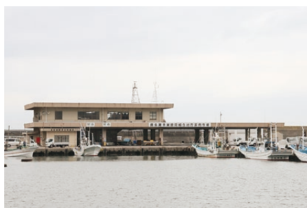
▲鹿島灘漁業協同組合には、銚田市から旧神栖町までの140人(準会員含む)の漁師が加盟。

東 日本大震災で大きな被害を受けた鹿島灘漁港。震災からまもなく4年になる今回は、鹿島灘漁業協同組合青年研究会の皆さんを取材しました。