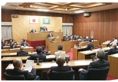
▲市役所3階にある、本会議場での一般質問の様子。議員からの質問を受けて、市長が答弁をしているところです。

12月9日、はまなすまちづくり委員会これこれセミナー、鹿嶋市議会を初めて傍聴する機会がありました。午後最初の傍聴でしたが、席がすぐ満席になり、午前中から傍聴された方もいて、感心度の高さが感じられました。 席に着くと、あの議員があそこにいる、あの人もいると、議会室全体を見回して暇もなく議員の質問が始まり、一瞬にして眠気も吹き飛び、白熱した議員と市長・担当部署との質疑応答に聴き入りました。