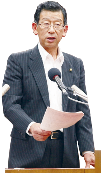
やまぐち てつひで 山口 哲秀 議員

総合戦略における施策については、一、地方における安定した雇用を創出する。二、地方への新しい人の流れをつくる。三、若い世代の結婚、出産、子育ての希望をかなえる。四、時代に合った地域をつくり、安心な暮らしを守るとともに、地域と地域を連携する。この国の示す4つの項目に沿って検討している。