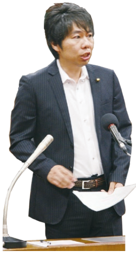
たかむら のりよし 高村 典令 議員

学校が必要とする支援活動を、公民館を核にして、地域住民による学校支援ボランティア活動をコーディネートしながら、地域と学校の連携を強化していきたい。さらには、地元の企業や研究機関などの人材活用を図るための、新たな連携事業の構築を図りたい。