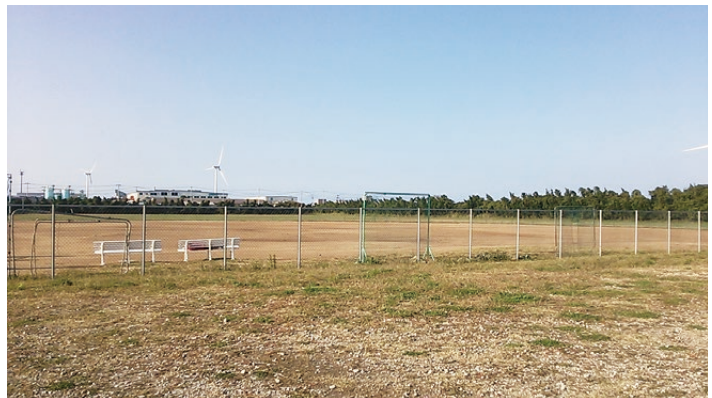
▲現在の北海浜球技場。今後、サッカーグラウンドが2面整備される。平成31年に開催される国体が待ち遠しい。