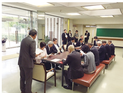
▲教育センターとして活用される、旧保健センターでの調査の様子。

採決の結果、本議案については、全会一致で、原案のとおり可決するべきと決まりました。