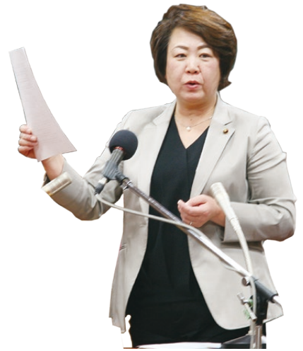
かわい ひろこ 川井 宏子 議員