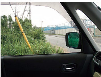
▲本道への合流箇所の安全確認がしやすいように、こまめな除草を望む。