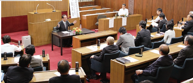
▲本会議場での講演会の様子。議会のありかたについて、笑いを交えながらお話いただきました。ありがとうございました。