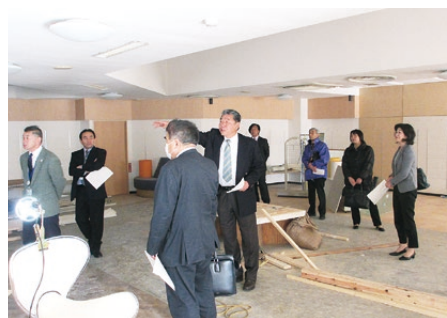
▲いきいきサロンへの改装の様子を視察