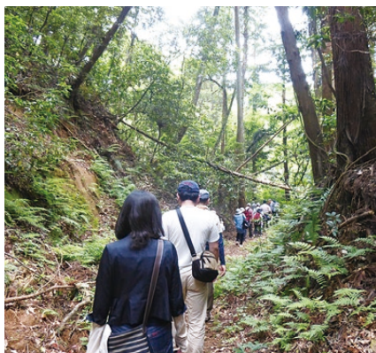
▲神の道の木々に囲まれた古道のコースでは、森林浴も楽しめる。