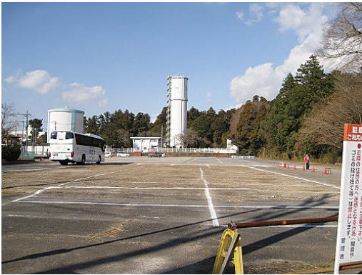
▲関鉄バスターミナル跡地。12,049㎡の面積のなかに、約2000㎡の歴史館建設の構想がある。

市長 宝物館と資料館を別にして街中にもっと資料館を、とのことだが、県に2つしかない国宝は集客力の目玉だと考える。発掘したものなどを一緒に見ってもらうことで意義があると考えた。