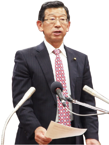
やまぐち てつひろ 山口 哲秀 議員

市民部生活長 浄化槽台帳の整備は、市の実情に合ったシステムの導入を検討しているが、本市単独で行うよりも県全体での導入を働きかけ、生活排水処理行政全般の、効率的で効果的な運営を図りたいと考えている。