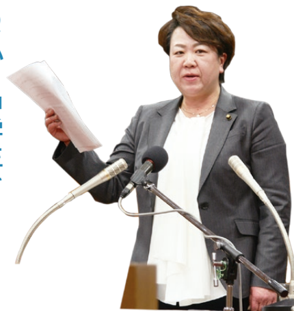
かわい ひろこ 川井 宏子 議員