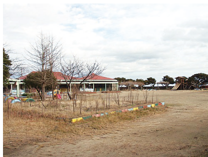
▲眺めもよく広い敷地の旧平井幼稚園。