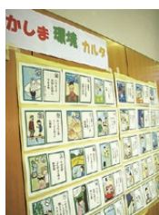
▲会場では環境サポーターの皆さんがつくった「かしま環境カルタ」も紹介。

青少年に有害なコンテンツが、インターネットなどを介して容易に閲覧することができている状況で、日本では禁じられていた内容のものであっても、海外のサーバーを経由して閲覧することができてしまう。もはや地方自治体の活動でこれらを制限するのは限界があるため、すぐにでも国レベルで対応していく必要がある。この請願は全国で提出されており、県内では22市町村が採択、1市議会でも採択という結果である。趣旨への賛同を願う。