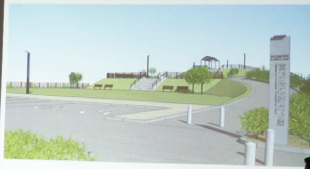
鹿嶋市議会 Copyright © Kamama City Assembly All rights reserved.