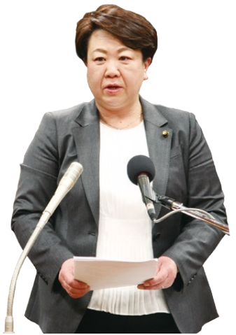
かわい ひろこ 川井 宏子 議員