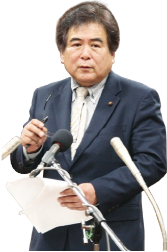
たちはら ひろいち 立原 弘一 議員

〔生活支援コーデイネーター〕 高齢者の生活支援などのサービス体制整備を推進するため、サービスの提供体制の構築に向けた資源の開発やネットワークづくりの機能を果たす人材。