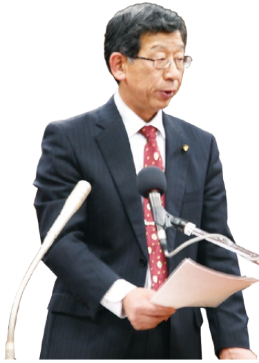
やまぐち てつひで 山口 哲秀 議員

猶予があり、経済的事由を対象とした基準を設ければ所得連動返還型奨学金制度と同様の効果があると考えられる。今後、検証していきたい。