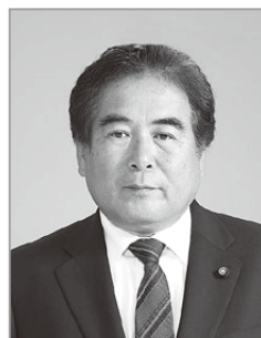
立原 ひろいち 議員 たちばら ひろいち