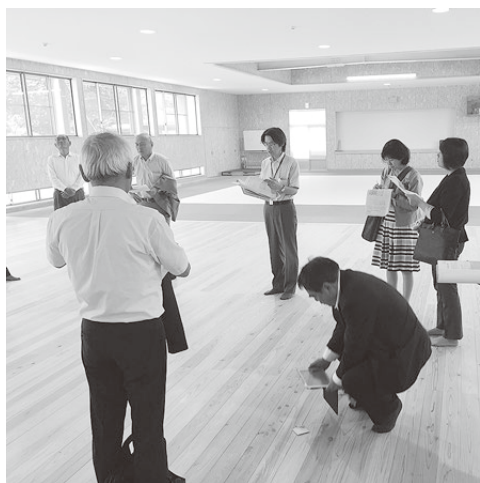
▲ 大野中学校の武道場。柔道や剣道の授業・部活動などで利用されている。床には杉の無垢材を使用し、体への負担が少ないようになっている。