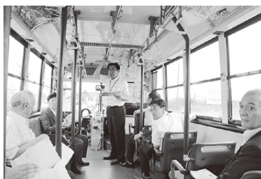
◀ 潮来駅～鹿島大野駅間を、約1時間で運行している広域連携路線バスに乗り乗しての調査。地域の魅力再発見にもつなげたい。