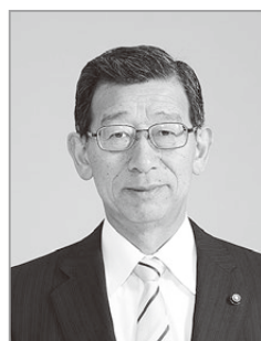
山口 哲秀 議員 やまぐち てつひて