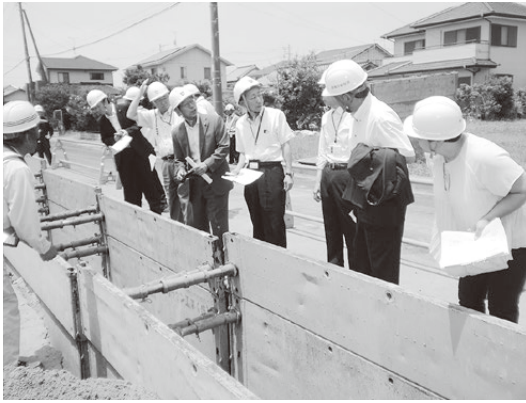
▶液状化対策工事の現場。この枠の中、地面から約3m下に、地下水を集めて排水する管が埋められる。

討論はありませんでした。採決の結果、全ての議案について、原案のとおり可決すべきと決定しました。