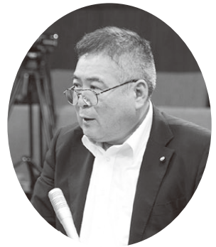
たちはら ひろいち 立原 弘一 議員

※D.M.O事業：「観光地経営」の視点で、多様な関係者と協働しながら、観光地域づくりを実現するための戦略の策定や組織づくりなど。