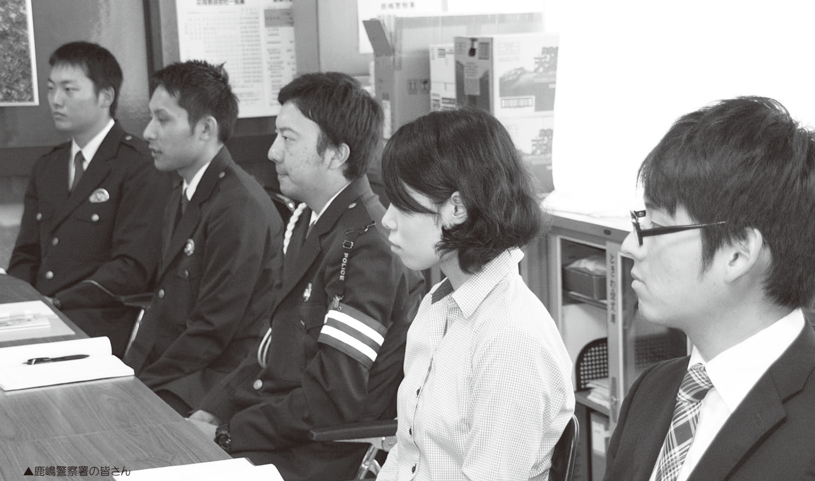
▲鹿嶋警察署の皆さん