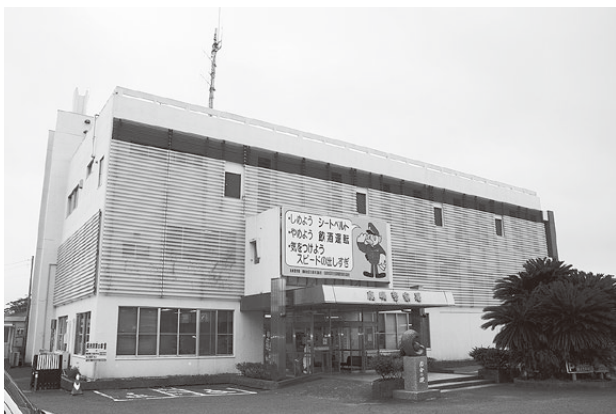
▲昭和47年に建築された鹿嶋警察署。8つの部署に分かれて日々業務にあたっている。