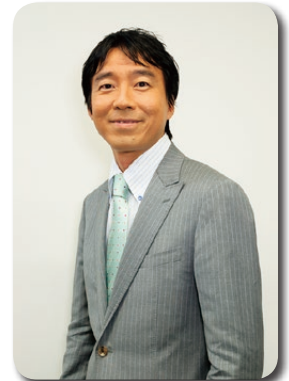
塩屋紀克アナウンサー