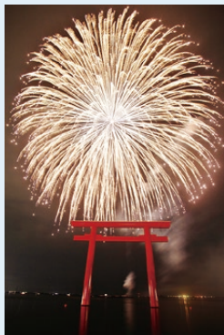
▲外国人に観てもらいたい 鹿嶋市花火大会