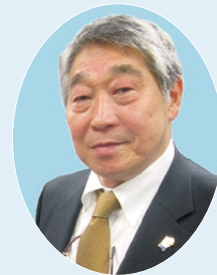
東京2020オリンピック・パラリンピック競技大会 鹿嶋市推進協議会 副会長

鹿嶋市観光協会は、鹿嶋市の観光資源を生かしながら、誘客促進を図るための観光事業の推進および県内外に向けて鹿嶋市のPR活動を行っています。