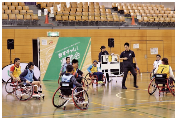
▲写真「オリンピックが茨城・鹿嶋にやってくる!～東京2020に向けた鹿嶋市開催2年前イベント～」