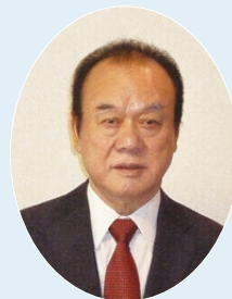
東京2020オリンピック・パラリンピック競技大会 鹿嶋市推進協議会 副会長

用した「外国人接客セミナー」を展開するほか、コミュニケーションツールとしてスマホ翻訳アプリの普及を積極的に行っています。 さらに、「キャッシュレス対応」として地元金融機関と連携し、説明会や体験の機会を提供しています。 大会機運の醸成として、市や商店会と連携した「会館前懸垂幕」、「街路灯フラッグ」の取り付けや、各種イベントでの特設PRコーナー設置などを行ってきました。 大会まで、あと1年余りです。大会の成功および地域の発展に向けて活動することが、大会後のレガシーや地域経済の成長に繋がると信じています。引き続き、鹿嶋市に来訪された方々にとって東京2020オリンピック競技大会が、生涯忘れぬ思い出になるように尽力していきます。