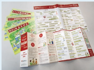
▲外国人の接客に役立つ3つのツール

周辺まち歩きマップ(英語版)(中国語版)を製作し、店舗・事業所へ配布しました。また、このツールを活用