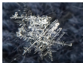
▲結晶「樹枝六花」