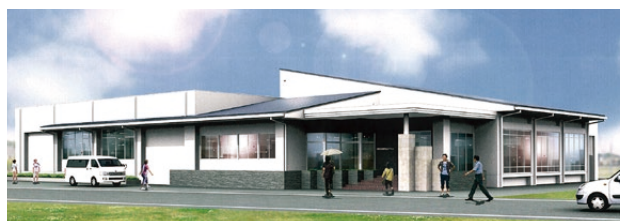
▲4月にオープン予定の「いきいきゆめプール」(完成イメージ図)