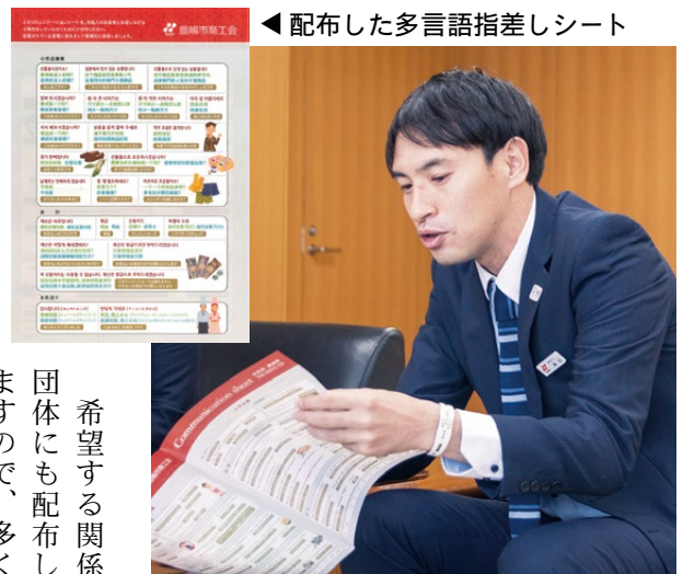
◀ 配布した多言語指差しシート

希望する関係団体にも配布しますので、多くの団体に活用していただきたいと思います。