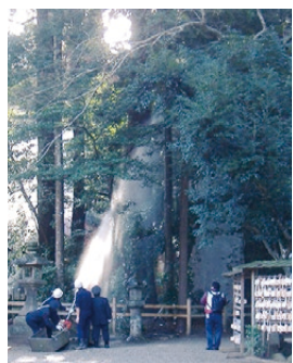
▲樹叢への放水訓練