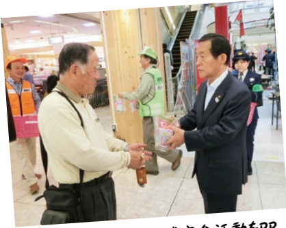
啓発品を配布し、地域安全活動をPR

時の見守りなどに積極的 に取り組んでいただき、 心から感謝しています。 今後、関係団体と連 携しながら、犯罪のない 安全で安心な鹿嶋づくり に取り組んでまいります。