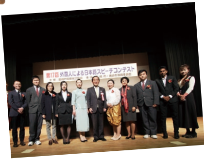
誰もが住みやすい環境づくりを進めます

には今後東京2020オリンピックの開催にあたり、世界から本市を訪れる方々に、ぜひ語学の分野などで活躍していただきたいと期待しております。