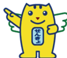
▲明るい選挙キャラクター「選挙のめいすいくん」