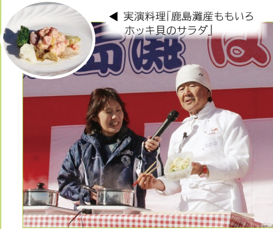
◀ 実演料理「鹿島灘産ももいろホッキ貝のサラダ」