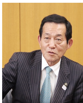
錦織 孝一 鹿嶋市長

具体的には、市費による教職員や専科担当講師を配置し、子どもたちへのきめ細やかな指導の充実