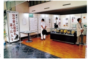
▲企画展「宮中野古墳群を造った人々」

また、同館では講演会のほか、企画展『宮中野古墳群を造った人々』も同時開催され、講演会に参加した方たちが、古墳と周辺集落の発掘調査の出土品などを興味深げに見学していました。