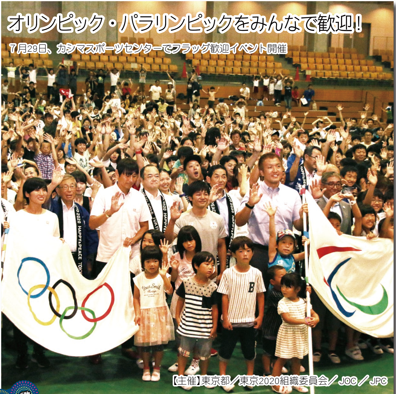
【主催】東京都／東京2020組織委員会／JOC／JPC