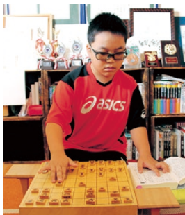
▲自宅では、実践書を片手に、棋譜並べに励む

1局が1時間以上にもわたるため、4局すべてが終了するのは17時頃となるそうです。