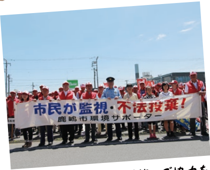
今後も、きれいなまちづくりへご協力を

いているおかげで、最近「まちがきれいになった」という言ばしい声が聞かれるようになりました。引き続き、市を挙げて不法投棄の撲滅に取り組んでまいります。