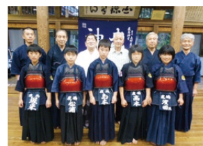
▲全国大会に出場する小学生(前列)