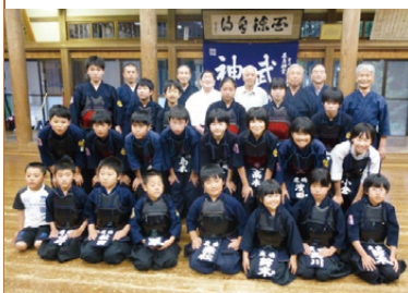
▲鹿島神宮道場の皆さん

練習では、まず黙想をして礼をもって始まり、その後約3時間、激しい動きを何度も繰り返します。そして、種目の切り替え時や防具を着脱するときは、一転して静寂が訪れます。練習は、動と静のメリハリの中で行われていました。