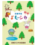
▲ 読書手帳『よむシカ』

6月から読書手帳『よむシカ』を配布しています。この手帳には、借りた本のタイトル・著者・借りた日付などをシールで貼って記録することができます。