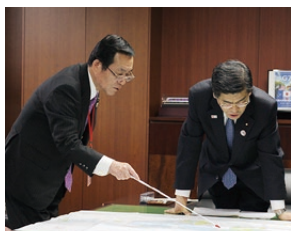
▲都市計画図を用い市内の状況を説明する市長

また、鹿嶋港については、鹿嶋臨海工業地帯の海上輸送および首都圏の東の玄関口としての物流機能の重要な役割を担うことから、引き続き競争力を高めていくことが必要となっています。