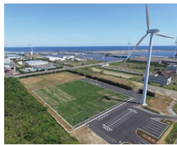
▲北海道多目的球技場

今後は、ト伝の郷運動公園多目的球技場の改修工事(人工芝張替・観客席常設・夜間照明整備など)と高松緑地多目的球技場の人工芝化工事を計画しています。