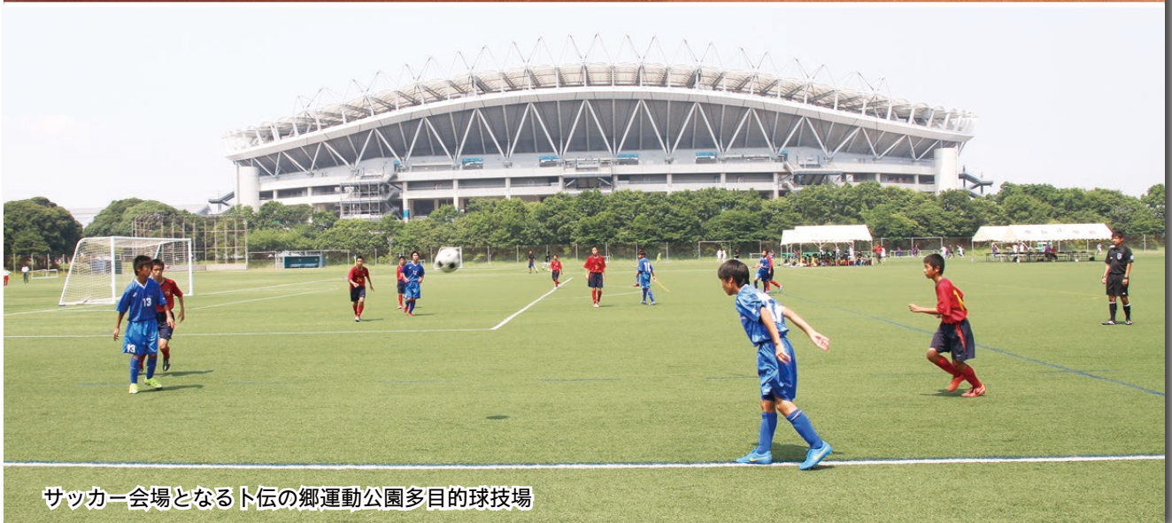
サッカー会場となるト伝の郷運動公園多目的球技場