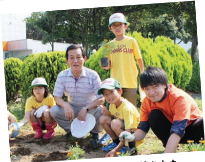
笑顔あふれるまちを築きます

今後も、笑顔があふれる明るい未来を市民の皆様と共に築いてまいりますので、ご協力をお願いします。