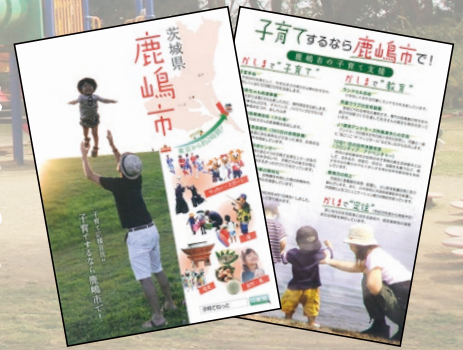
▲チラシを作ってPRしています

このような中、平成29年度の新たな取り組みとして、本市が将来に渡って活力ある発展を目指すため、特に若年世代の定住・移住を促進する「住宅取得助成制度」や「固定資産税の減免制度」などを創設いたしました。今後は、主に東京圏の学生や移住希望者を対象とした各種相談会や本市のPR事業などを積極的に取り組んでいきます。