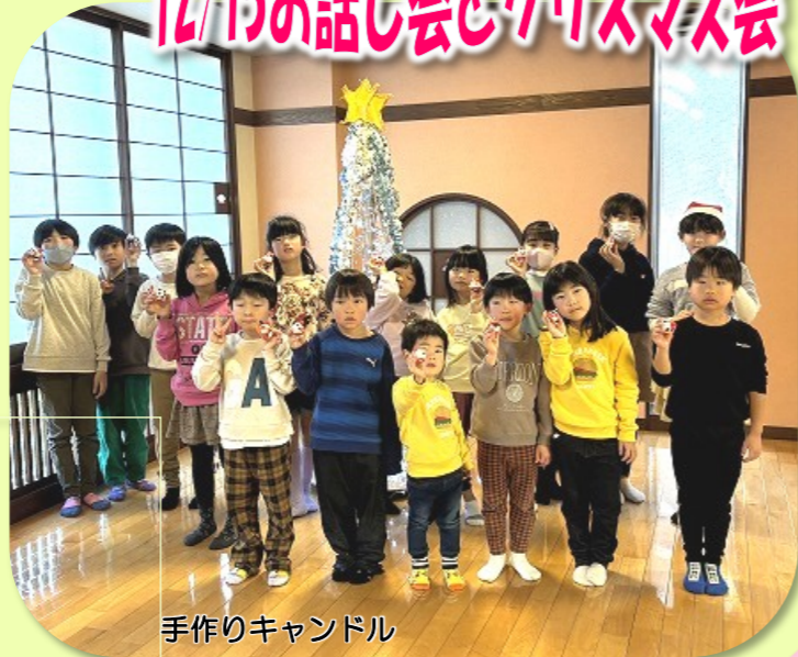
手作りキャンドル

前半は「てぶくろの会」のみなさんによるクリスマスの楽しい読み聞かせ、後半は手でこねて簡単に作れる「クリスマスキャンドル」をみんなで作りました。