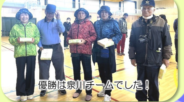
優勝は泉川チームでした!

2月1日(土)鹿嶋市のポッチャ大会へ高松地区代表として4チームが参加し大健闘でした! お疲れさまでした。