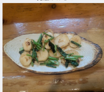
カブのニンニク炒め