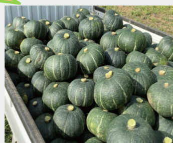
収穫されたかぼちゃ