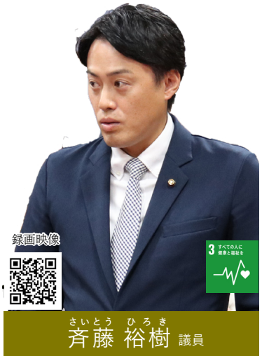
さいとう ひろき 齊藤 裕樹 議員

問 全国で新型コロナウイルスの被害が多く発生している。厚生労働省発表のコロナワクチン接種後の死亡者数、副反応報告数、健康被害申請数について最新の状況を伺う。