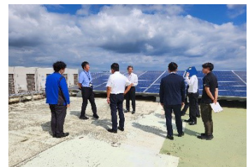
庁舎の調査を行う総務生活分科会

庁舎の適正な維持管理と来庁者の利用しやすい環境の整備については行政が行う必要があるが、事業の目的は妥当である。各種業務委託や光熱水費、消耗品の購入等についても、近年の電力高騰や物価上昇の中、効果的に行われている。第1庁舎は築年数が50年を超えているが、耐震補強がされ、防水補修工事等のメンテナンスもされており、適切に管理されている。