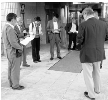
大野潮騒はまなす公園の現地調査

採決の結果、都市経済委員会で審査した12議案は全て全員賛成で原案のとおり可決すべきと決定しました。