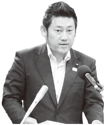
ささぬま やすひろ 笹沼 康弘 議員