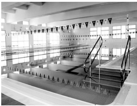
いきいきゆめプール

採決の結果、議案第48号、議案第49号、議案第69号は全員賛成で、議案第61号から議案第66号は賛成多数で、原案のとおり可決すべきと決定しました。また、請願についても採択するべきと決定しました。