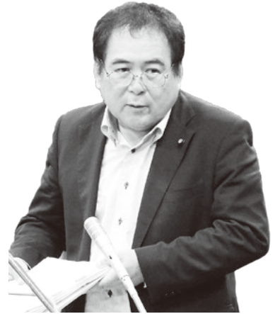
たちばな ひろいち 立原 弘一 議員 〔発言時間＝90分〕