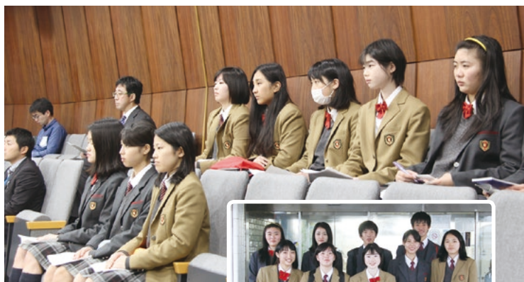
傍聴に訪れた鹿島学園 高校の生徒たち

今回の傍聴は国際知識の授業の一環として、 自分たちが学んできた他国の国政議会・ 地方議会と比較検討や地方議会の運営や地方自治 について学ぶことを目的に傍聴されました。