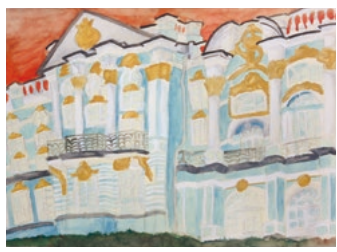
『宮殿にも秋の訪れ』鹿嶋市教育会 児童生徒作品展に出展した作品

私の夢は、漫画家になることです。読んでくれた人たちを笑わせて、元気になってくれるようなものを描きたいです。もともと絵を描くことが好きなのですが、マンガを読むことも大好きです。何十冊も一度に読んでも飽きず、それなら自分で描いてみようと思