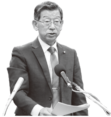
やまぐち てつひで 山口 哲秀 議員