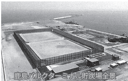
鹿島バルクターミナル貯炭場全景