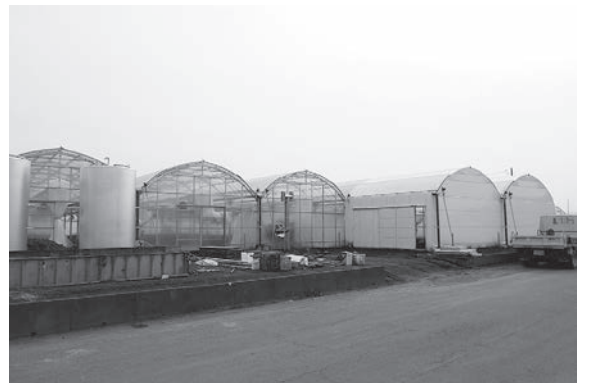
▲ 補助金を利用して設置した大型ハウス