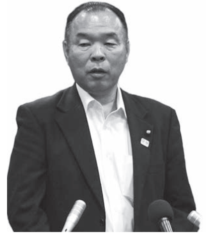
ひぐち ふじお 議員 樋口 富士男 〔発言時間＝60分〕