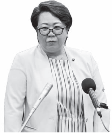
かわい ひろこ 議員 川井 宏子 〔発言時間＝70分〕

一般質問は、私たちの生活にかかわりの深い事柄について質問するものです。掲載した内容の詳細は、鹿嶋市議会のホームページにある「インターネット中継」または「録音中継」をご利用ください。