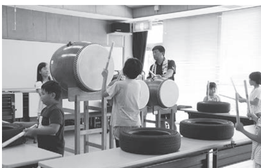
▲コミュニティ助成事業補助金でつくられた和太鼓

討論はありませんでした。採決の結果、全員賛成で、原案のとおり可決すべきと決定しました。