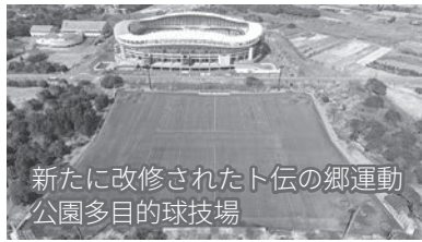
新たに改修されたト伝の郷運動公園多目的球技場

利用料が上がるが、市民への事前説明は。年間のスケジュールを決める利用団体との調整会議で話をしていく。また、10月改正予定なので、それまでに利用者に十分周知をしていく。