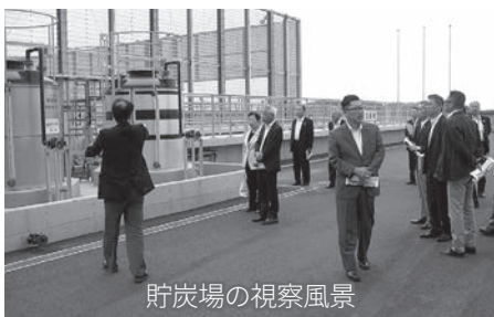
貯炭場の視察風景

市では、同社の経営に参画することが鹿島港の発展、地域経済の活性化に有益であるとの判断から、一千万円の出資参加をしています。 ※第一船は2日遅れの22日に入港、貯炭場が稼働した。