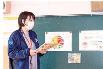
(左) 保健師による身体測定 (中央) 保育士による「大きくなったかな」 (右) 管理栄養士による「離乳食講座」