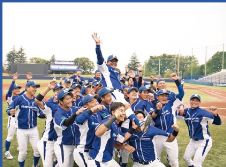
▲2020年都市対抗野球本大会出場を決めた北関東大会