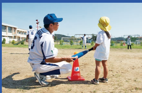
▲ティーボール授業で園児と交流