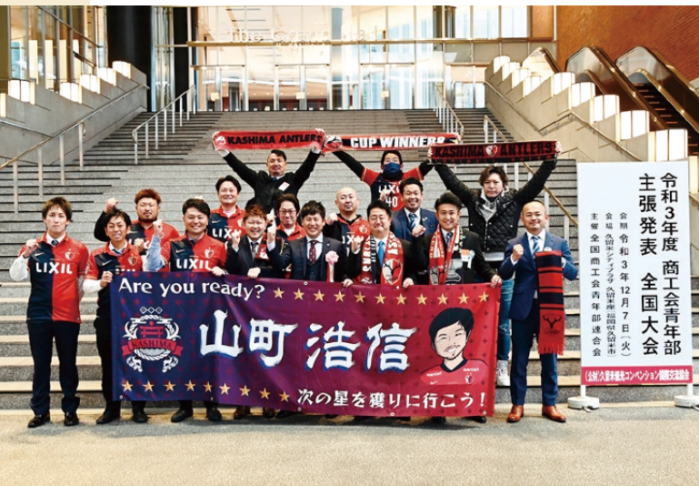
▲福岡県久留米市の会場に、応援に駆け付けた青年部の皆さん

これに限らず、個人では難しいけれど「やりたいこと」「マチの課題を解決する」といったチャレンジできる環境を整っている商工会に感謝しています。