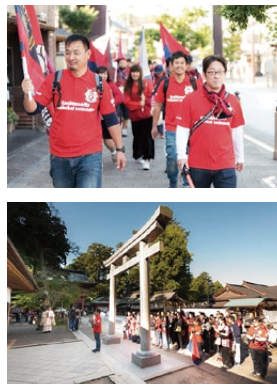
◀平成30年11月3日、ACL決勝第1戦のときのアントラーズ必勝祈願ウォーキング。