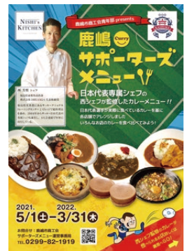
▲3月31日まで開催中！詳細は右記QRコードから。

これらの企画の実現は、平成27年の青年部「アントラーズ応援委員会」の立ち上げに由来します。そして、もとをたどれば「リーディング開幕当時のマチの盛り上がりを取り戻したい」という私の思いを、