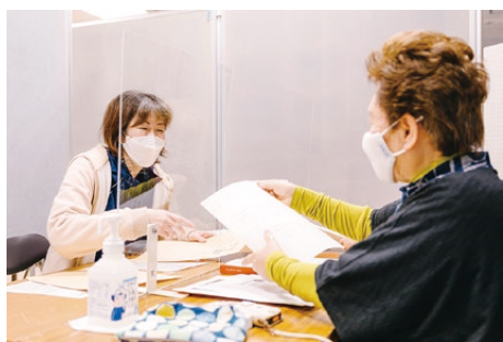
▲気軽に、誰でも相談することができます。

経営課題に対して資格を持つ「経営指導員」と「専門家」がアドバイスを行う伴走型の企業支援を行っています。