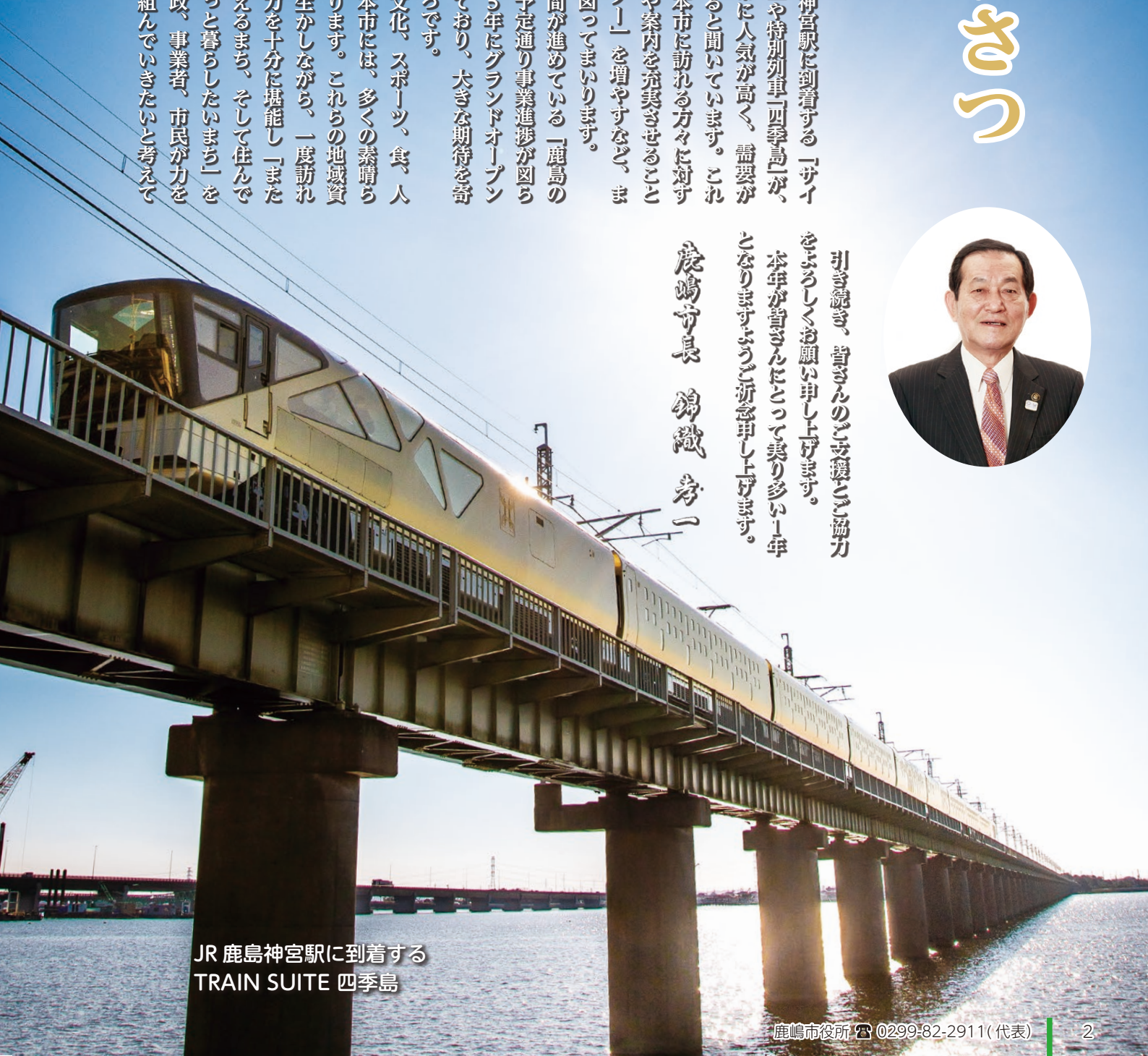
JR 鹿島神宮駅に到着する TRAIN SUITE 四季島