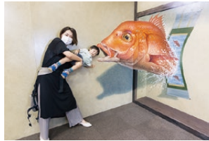
◀▲昨年夏に、鹿嶋市商工会館で開催した「トリックアート展 in 鹿嶋 (大江戸物語)」

一方で、自営業ではない多くの皆さんには「かしま商江夏まつり」や「かしま大彩まつり」を主催、市や市内企業と協力して「鹿嶋まつり」を開催する団体と言ったほうが馴染み深いかもしれません。