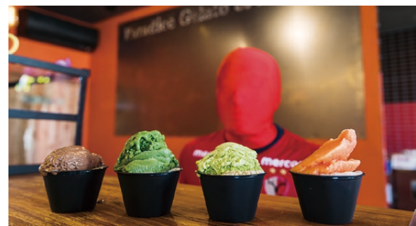
▲12種類のフレーバー(写真は左からチョコレート、抹茶、ピスタチオ、ブラッドオレンジ)が楽しめるゼツ

ジェラートが冷たくておいしいのはもちろんだが、それで終わらないぜ。乳製品・卵は使わず、自家製の豆乳とてんさい糖で作られているから、素材の味が生