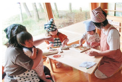
▲親子で料理「ピザ作り」