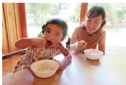
▲梅シロップかき氷