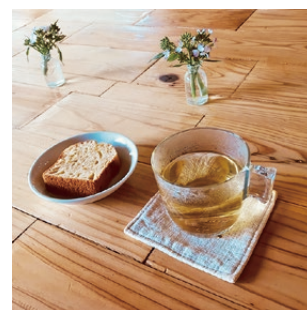
▲ほかぼかルーム 「手作り梅ジャムのパウンドケーキ」