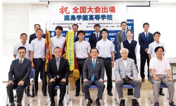
▲全国大会に出場する鹿嶋学園高等学校(硬式野球部、男子サッカー部、レスリング部、水泳部、陸上部)の皆さん

このような中、「鹿嶋学園高等学校 硬式野球部」の甲子園への初出場には、大いに歓喜し、震えるほどの感動を覚えました。市内の高校としては、初めての快挙であり、「サッカーだけではない、野球も強い!」と、