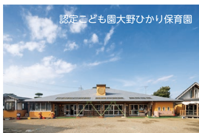
認定こども園大野ひかり保育園

認定こども園大野めぐみ保育園は太平洋、同大野ひかり保育園は北浦に面し、自然に囲まれた環境の中で「ありがとう」が言えます。ごめんなさいを素直に言える子どもを保育信条に掲げ、日々の保育に精進しています。 大野めぐみ保育園は、開園64年目を迎え、養護と教育、子どもたちの心と体、一人ひとりの育ちを大切に援助し、保護者の皆さんと喜びを共有しています。また、未就園児のご家庭の方も、同園内のすこやか広場(右ページ参照)で子育て相談やほかの親子との交流もできます。 〔園の特色ある活動など〕 □ 毎日の日課活動(言葉の教育、漢字・百玉そろばん・時計の読み方などの指導) □ 年長・年中児による鼓隊(大野めぐみ)・和大鼓(大野ひかり)演奏 □ 慈眼寺境内での盆踊り大会 ※このほかにも、さまざまな体験活動を行っています。