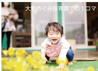
大野めぐみ保育園での1コマ

この世に生を受けたことに感謝し、子どもたちの豊かな育みを祈りながら、一人ひとりに「あなたは、かけがえのない子どもです」というメッセージを伝え続けていきたいと思えます。