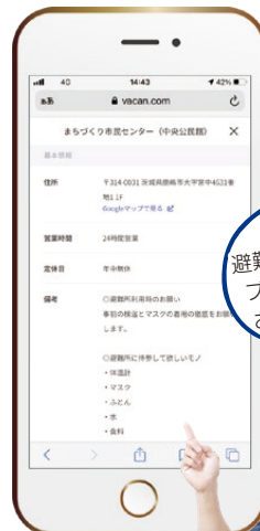
▲ VACAN の利用イメージ