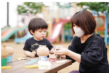
▲親子で一緒に制作活動