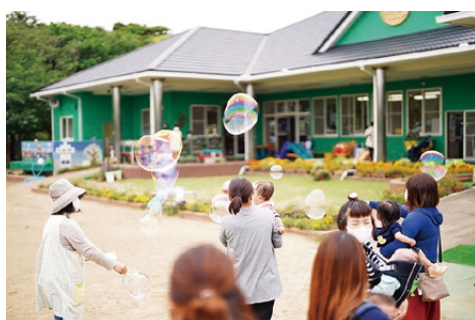
▲大きなシャボン玉ではじける笑顔

認定こども園大野めぐみ保育園の敷地内にある「すこやか広場」は、月曜日から金曜日まで、主に未就園のお子さんとその保護者を対象に親子が集える場として開放しています。