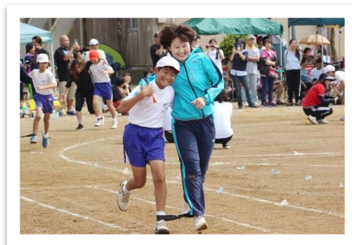
△ 息子さんとの運動会での1コマ。頑張れ~!!