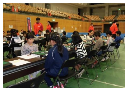
▲ Enjoy Sports ☆ スポーツWS ▲ (左) バランスボール / (右) キッドピクス