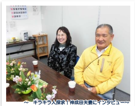
～キラキラ人探求！神成田夫妻にインタビュー～