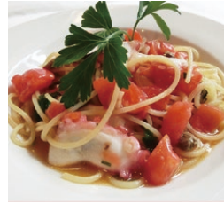
フレッシュトマトと鹿島 だこのスパゲッティアン チョビ風味(1,100円)