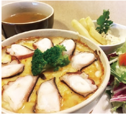
鹿島だこのドリア プレート(1,000円)