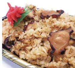
鹿島だこのたこ飯 (440円)