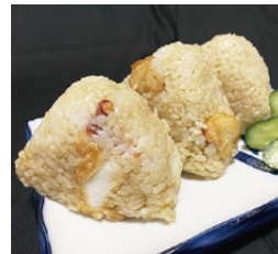
たこ天にぎり (1個200円)