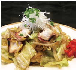
鹿島だこのしょう油 焼きそば(900円)