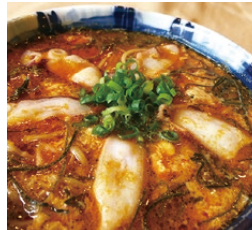
鹿島だこのかき玉そば (1,000円)