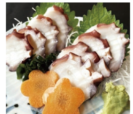
鹿島だこのタコ刺し (1,100円)