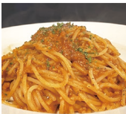
鹿島だこのトマトラグー (1,210円)