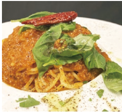
鹿島だこのラグースパ ゲッティ (1,300円)