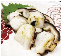
タコのたたき炭火焼き風 (680円)