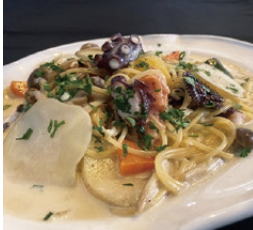
鹿島だこと彩野菜の あったかクリームスープ パスタ(1,380円)