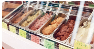
▲定番のミルクやチョコレート、人気のピスタチオ、季節のジェラートなどが並び

お店のショーケースには常時、有名シェフのもとで修行した経験を生かした6種類のジェラートとチーズケーキ、コンフィチュールなどが並びます。特にジェラートは「素材の味・季節の味を楽しんでもらいたい」とこだわっています。