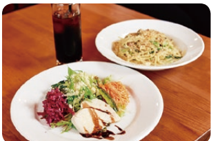
▲人気のランチセット (写真はパスタ)