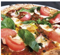
鹿島だこのピッツァ サンタルチア(1,760円)