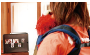
▲コロナ禍では、Zoom(Web会議ツール)を利用して講座を開催

送迎や物の貸し借り、お出かけのお誘いなどもでき、お互いにシェアできるのは知り合いに限られるため安心。さらに、アプリを利用したシェアであれば、万が一の事故にも保険が適用されます。