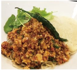
鹿島だこの青唐辛子 味噌ピリ辛山かけそば (1,500円)