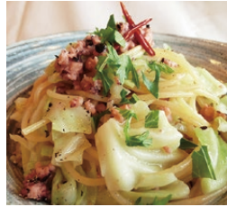
鹿島だこラグーと 冬キャベツのペペロン チーノ(1,540円)