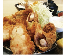
タコ・エビかつ・アジ定 食(1,380円)