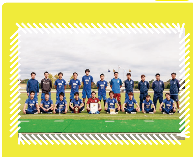
鹿島さわやかFC ■第27回全国クラブチームサッカー選手権大会 準優勝(10月24日～27日・茨城県)