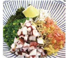
鹿島だこのオリーブ まぜそば(880円)