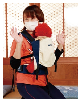
▲抱っこひもの正しい付け方。12月16日の講座「育児姿勢がもたらす不調」から。