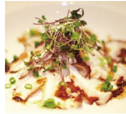
鹿島だこの瞬間スモーク (1,100円)